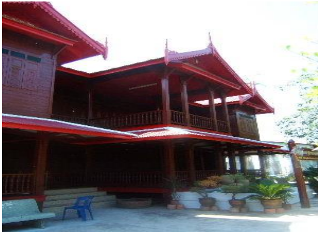
โรงเรียนพระปริยัติธรรมหลังเก่าของวัดบางปลา กำลังจะกลายเป็น พิพิธภัณฑ์ชุมชนวัดบางปลา ในขณะนี้